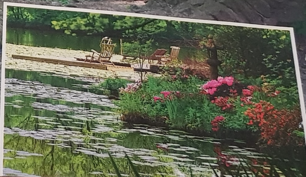
Ein idyllisches Plätzchen, um die Seele baumeln zu lassen: der Schlosssteich mit seinen unzähligen Seerosen

Das Mondtor (l.) symbolisiert Yin und Yang. Dem Besucher erschließt sich eine Sichtachse bis zur Roten Brücke im japanischen Moosgarten