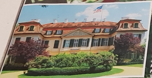
Das Barockschloss im fränkischen Unterschwaningen ist seit 190 Jahren im Besitz der Freiherrlichen Familie von Süßkind

Wer Schloss Dennenlohe und seinen Park links liegen lässt, hat viel versäumt