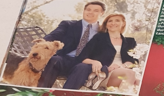
Wenn immer es ihre Zeit erlaubt, wandert die Baronin, genannt „Fanny“, mit ihren Hunden durch den Landschaftspark