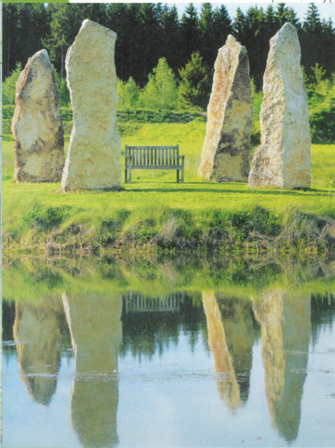
Verrassende ideeën van de tuinarchitect: menhirs op een eilandje en Boeddha in het bamboebos.